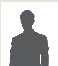
メーカー T 様

知り合いの経営者にさそわれて参加しました。視察に行く前は、「自社がインドとビジネス？できるのかな、本当に…」、というのが正直な気持ちでした。実際に現地を訪れると、インドの活気をありありと感じました。そんな雰囲気の中、視察地でインド人や日本人駐在者のリアルな話を生で聞いたことにより、いろいろなアイデアが生まれてきました。帰国後の現在は、現地で生んだアイデアを商品化するところまでこぎつけました。現地の業法など、調査をしてクリアしなければならない課題は複数ありますが、この目で見て感じ取ったあのインド経済の熱気を思い出しながら、ビジネスの成功に向けてひた走っています。あの時視察に参加していなければ、インドを事業として検討すべきかどうかさえ、いまだに分らないままだったと思います。「分からないから何もしない。」というのは非常にもったいない。まずは自身の目でインドを見てみることを、経営者仲間にも勧めています。アイデアが次々に湧いてくるあの感覚を、体験してほしいと思います。